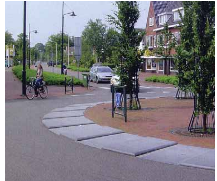
het hart van de rotonde is laag en kent geen verkeerstechnische verhoging, daarnaast zijn de banden van een antracietgrijs natuursteen materiaal