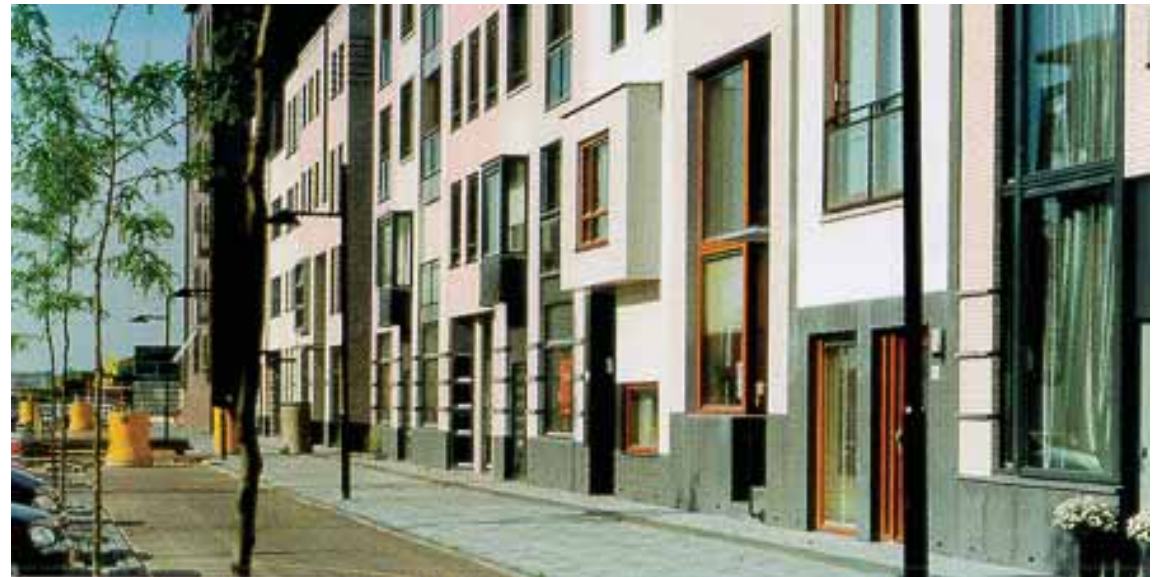
langs de nieuwe bypass komt een stevige wandbebouwing, een plint, een trottoir met een bomenrij en langspaarkeervakken