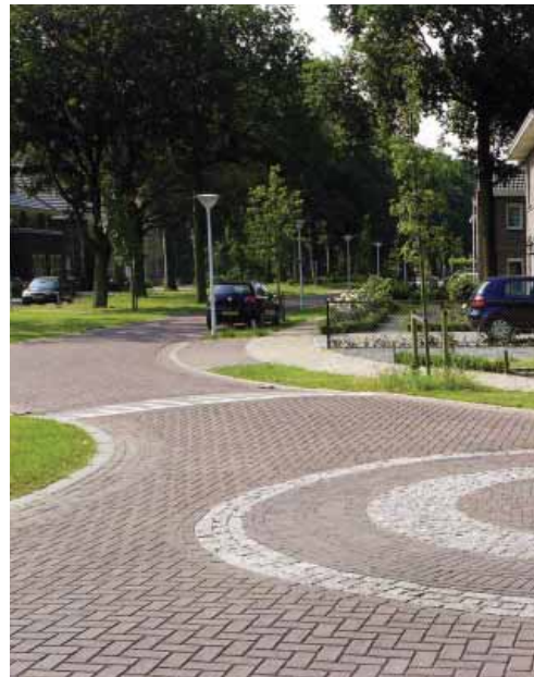
een rotonde met een dorpse schaal en maat