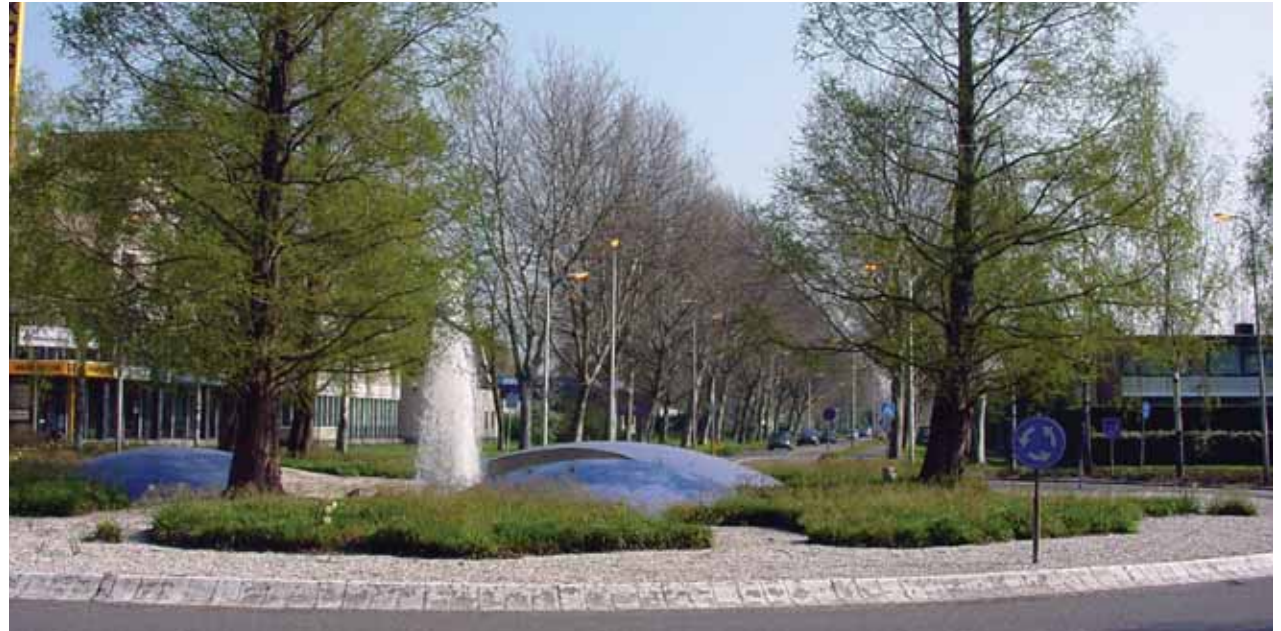
in de nieuwe situatie moet de zichtlijn van de Soestdijkseweg zichtbaar blijven, zoals in deze referentiefoto de rotonde vraagt om een apart ontwerp met eventueel beplanting, steen en of bijzondere (water)elementen