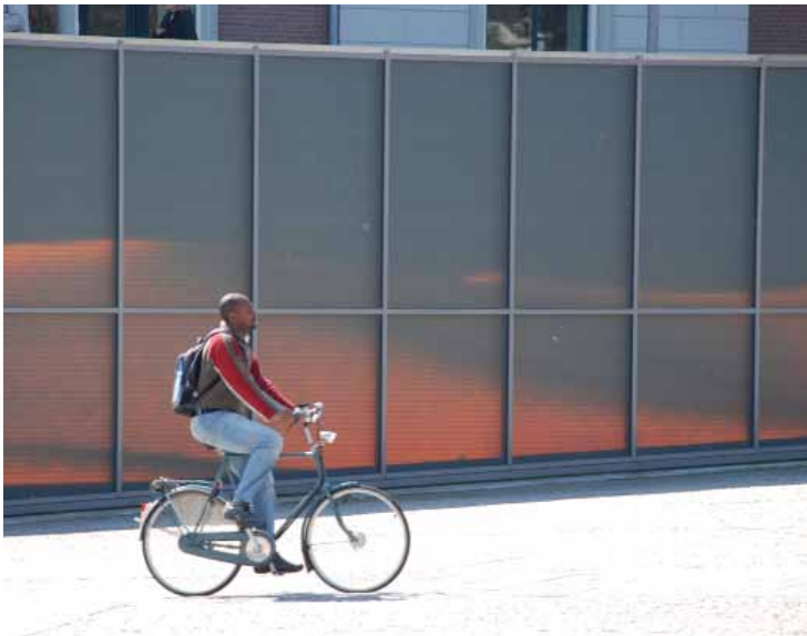
er wordt veel aandacht geschonken aan de 'wanden' van het stationsgebied