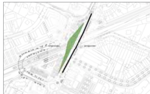
conceptschetsen herinrichting stationsgebied