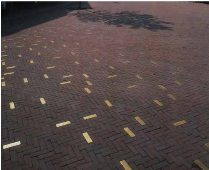
accenten in de stoep verbijzonderen de vloer van het stationsgebied