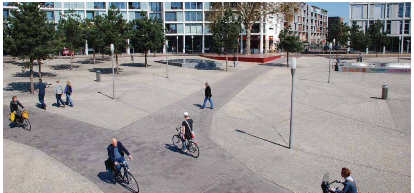
referentiebeeld voor het stationsgebied met een functionele loper voor het langzaam verkeer