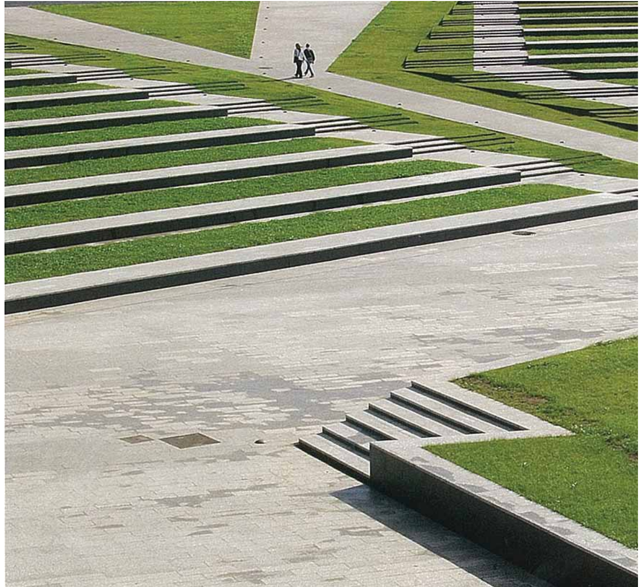
in het nieuwe stationsgebied is er veel aandacht voor groene trappen, bijzondere (water-)elementen en voor de afwerking van de 'wanden'