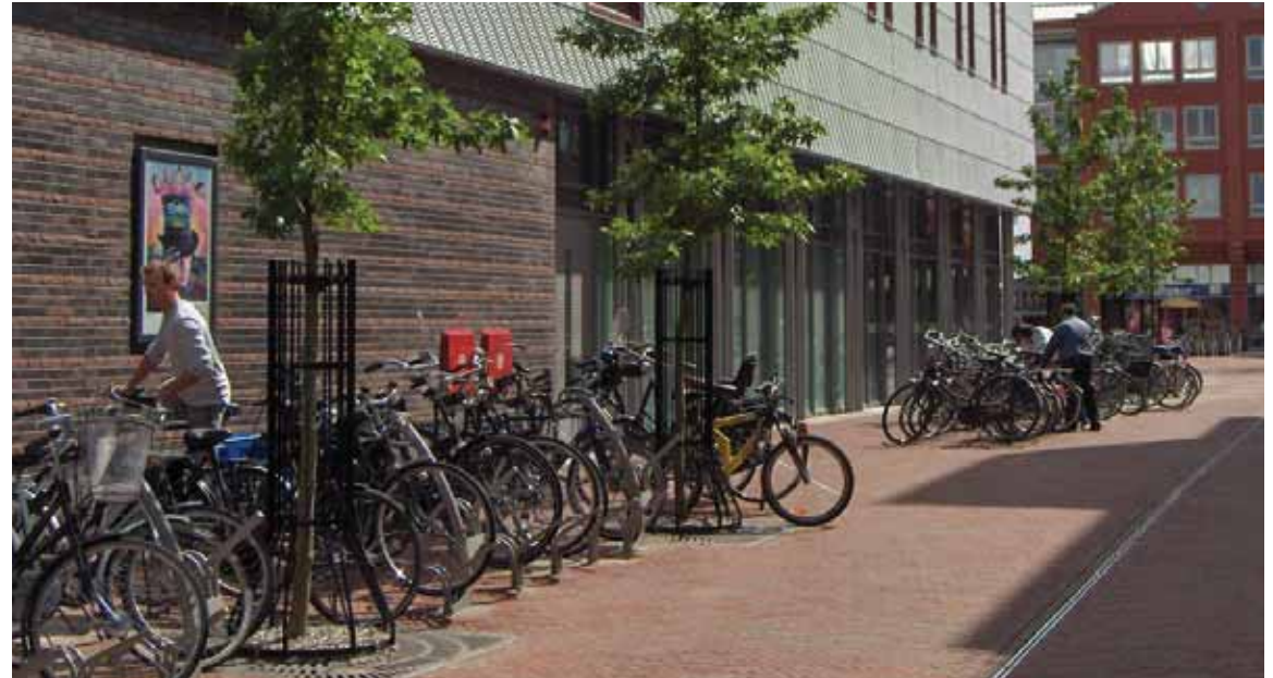
veel aandacht voor de grote hoeveelheid fietsparkeerplaatsen en de 'losse' solitaire bomen in de verharding